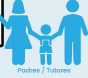
Padres / Tutores

Tome esta encuesta para compartir lo que piensa acerca de sus experiencias de usted y de su hijo/a en su escuela. Usa los resultados para conocer mejor el ambiente escolar con tus niña/os, maestras/os, administradores y otros padres.