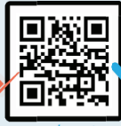
Parents / Guardians and Staff Take the survey online here