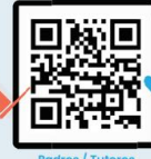
Padres / Tutores y el Empleados responde la encuesta en línea aquí